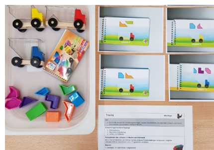
Die «Truckys» zu beladen, ist knifflig, aber trotzdem beliebt.