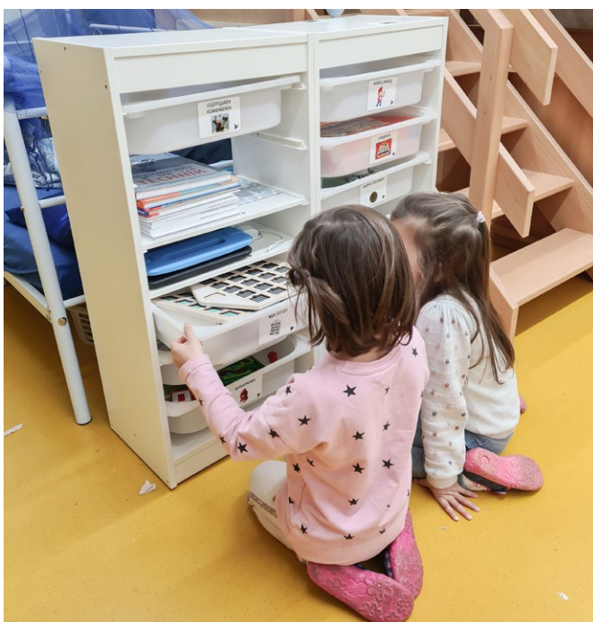
«Die Kinder lieben es!»: Das MIA-Regal bietet neun Lernspiele und zwei iPads.