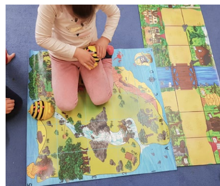
Beebots: Ist die Biene programmiert, sucht und findet sie den Weg.

Sie begrüsst die Kinder und fängt mit dem angeleiteten Teil des Unterrichts an. Dafür erklärt sie den Kindern das Lernspiel Rotkäppchen. Zuerst erzählen die Kinder, was sie alles über das