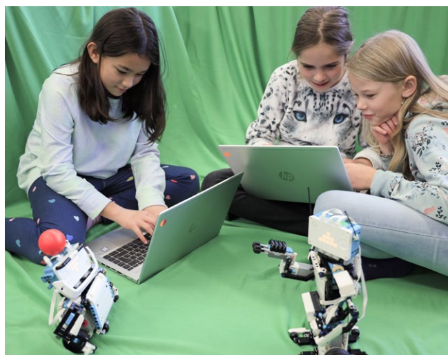
Der Robotell wartet auf die Befehle seiner Programmiererinnen.