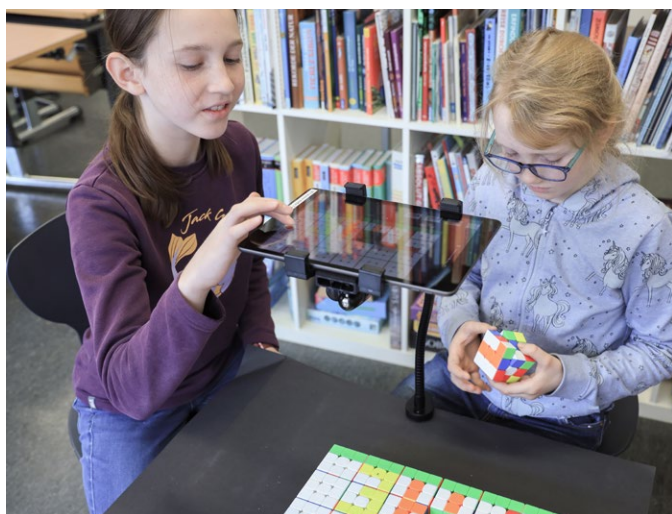
Für jedes Einzelbild werden 216 Rubik-Pixel in Position gebracht.