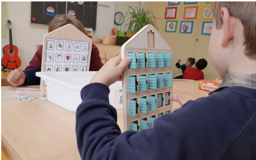
Das MIA-Gestell enthält auch analoge Spiele: Wer ist es? Fragen helfen herauszufinden, welches Tier der Spielpartner gewählt hat.

Rotkäppchen wissen. Die Lehrerin zeigt das Spielbrett, das Haus und die Spielzeugteile. Rotkäppchen und der Wolf brauchen einen Weg zum Haus. Deshalb versuchen die Kinder, die Platten richtig auf das Spielbrett zu legen. Das schult das Vorstellungsvermögen und die Suche nach Lösungswegen. Das Spiel findet grossen Anklang. Fast jedes Kind will Rotkäppchen den Weg zum Haus zeigen.