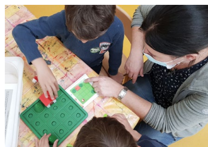
Spielbrett Rotkäppchen schult das Vorstellungsvermögen.